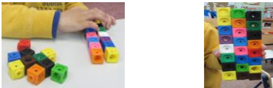
Figura 2. Christian forma tres grupos de 7 y redistribuye los tres cubos sobrantes A partir de que se halla la primera solución, hemos encontrado tres estrategias para producir soluciones a partir de otras: (a) volver a la disposición inicial con

Como ejemplo de la estrategia de grupos iguales con tanteo y redistribución, presentamos el trabajo de Christian, que toma 24 cubos y comienza formando una fila de siete cubos encajados (figura 2). Después construye otra fila igual y compara las longitudes de ambas filas (figura 2, izquierda). Al formar la tercera fila de siete, observa que sobran tres cubos y los distribuye en las tres filas para obtener la primera solución de tres filas de ocho objetos (figura 2, derecha).